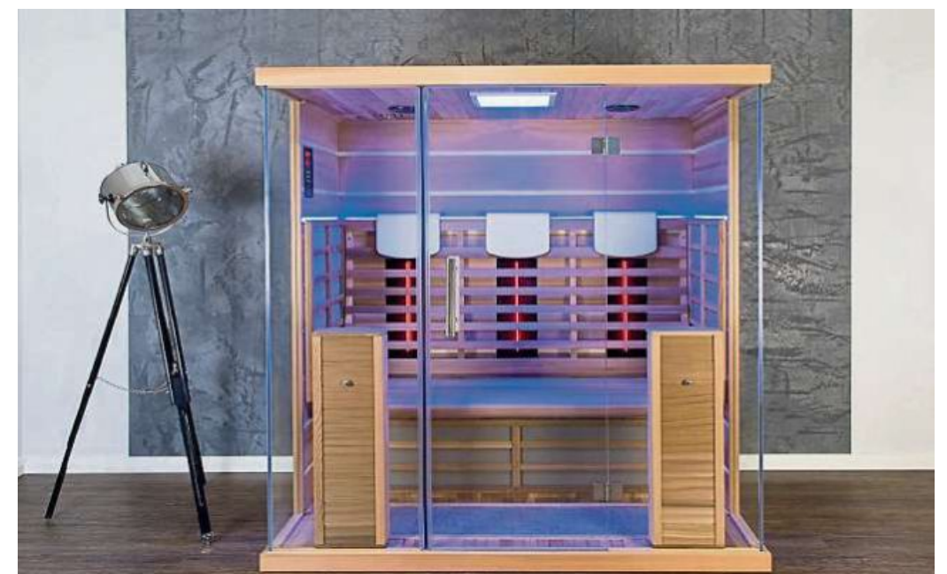
Infrarotkabinen von Sauna Becker sparen Energie und steigern Gesundheit und Wohlbefinden.

Die Wärmestrahlen einer Infracabine lockern die Mus- keln, steigern die Durchblutung und lösen Verspannungen. Die sanfte Erhöhung der Körpertem- peratur wirkt wie künstliches Fieber und regt die Immunab- wehr des Körpers an. Regelmä- ßige Ganzkörper-Wärmebäder mit Infrarotstrahlung stärken die körpereigenen Abwehrkräfte und trainieren das Immunsys- tem. Das Verweilen in einer Infracabine dient der Entspannung von Körper und Geist. Die Temperaturen von ca. 40 bis 50 Grad Celsius sind sehr angenehm und ohne Belastung für den Organismus. Für Senio- ren, Kinder und Sportler ist die