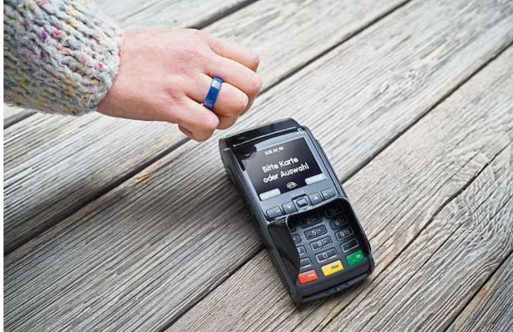
Mit dem Bezahrling können Kreditkarteninhaber stylish bezahlen.

und starten“, erklärt Weimann. Man müsse nur beim Bezahlen die Hand an das Kassenterminal halten. Ab einem Betrag von über 50 Euro werde zusätzlich die Pin der Visa-Kreditkarte abgefragt. Wer Interesse hat und Inhaber einer Visa-Kreditkarte der VR Bank ist, kann seinen Bezahrling einfach online bestellen unter www.vrbank-lahndill.de/wearable . Besucher der Gewerbeschau Dautphetal können sich den Ring live anschauen. Die Kolleginnen und Kollegen der VR Bank Lahn-Dill vor Ort beraten Sie gerne! Kontakt: VR Bank Lahn-Dill, Beratungszentrum Dautphe, Gladenbacher Straße 46, 35232 Dautphetal, Telefon 06461-70081203, www.vrbank-lahndill.de .