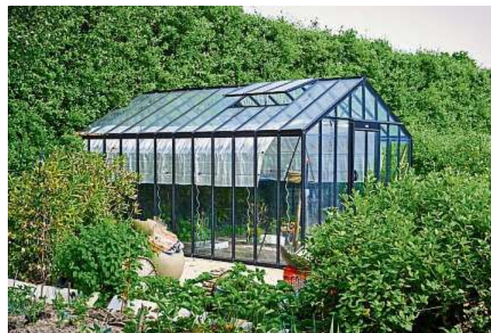
Für genügend Licht ist eine Ost-West-Ausrichtung bei frei stehenden Gewächshäusern ideal.

(gpp). Wer sich ein Gewächshaus in den Garten stellt, möchte den perfekten Raum für die Kultur von Pflanzen, weiß Markus Botz, Spezialist bei einem großen Hersteller von innovativen Gewächshäusern. Damit Pflanzen gut wachsen, müssen ihre Ansprüche möglichst gut erfüllt werden. Dabei geht es um das Zusammenspiel der Wachstumsfaktoren Licht, Wärme, Luft, Wasser, Nährstoffe (Boden). „Soweit die Theorie, aber in der Praxis zeigt sich, dass der wichtigste Wachstumsfaktor immer noch der handelnde Mensch ist“, sagt Botz. „Wir schaffen mit unseren Gewächshäusern beste bauliche Voraussetzungen, aber dann beginnt die spannende Entdeckungsreise.“ Was aber sind die guten Voraussetzungen, die ein Gewächshaus bieten sollte? „Licht ist als Energielieferant ein entscheidender Wachstumsfaktor, deshalb ist ein maximaler Lichteinfall wichtig“, so Botz, „aber da Licht auch für die Aufheizung im Gewächshaus sorgt, ist auch eine sichere Lüftung