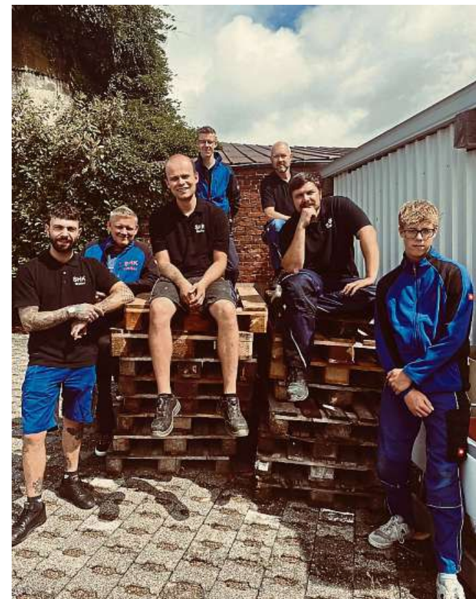
Das Team von SHK Weiler ist mit Engagement im Einsatz und rund um die Uhr erreichbar.

„Gönnen Sie sich ein zeitlos schönes Bad, das Ihnen auch im Alter Freiheit schenkt, eine intelligente Heizung, mit der Sie