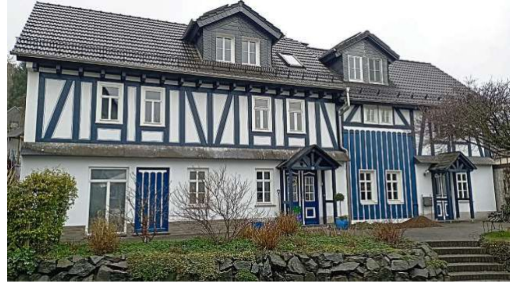
Die Firma Velte Edelputz ist kompetenter Ansprechpartner, wenn es um die Fassadensanierung älterer Häuser und Höfe geht.

Putz, außen oder innen – die Mitarbeiter der Firma Velte Edelputz beraten kompetent und umfassend zu verschiedenen Themen. Über die reine Gestaltung hinaus bietet die Firma Velte auch spezielle Dünn- und Heiz-Estriche an, mit deren Einsatz zusammen mit neuen Heizsystemen auch in Altbauten mit geringer Raumhöhe eine Fußbodenheizung möglich wird. Zudem bietet Velte Fließestricharbeiten, Sanierputzarbeiten sowie Dämmsysteme in und am Eigenheim, Material für Heimwerker und einiges mehr an. Kontakt: Velte Edelputz, Eichelohstraße 6, 35232 Dautphetal-Silberg, Telefon 06468-7408, www.velte-edelputz.de.