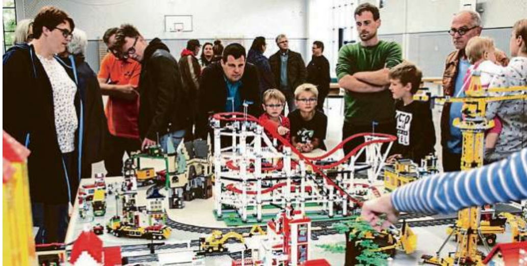
Das Spielen fördert Denkvermögen, Gedächtnisleistung und Kommunikation.

Das ursprünglich aus Südafrika stammende Lernkonzept nutzt die bekannten Bausteine genutzt, um die körperliche, kognitive, soziale und emotionale Entwicklung von Kindern zu unterstützen. Über 500 verschiedene Aktivitäten mit den bunten Klötzen stehen zur Verfügung. Sie können eingesetzt werden, um Aufmerksamkeitsdefizite zu beheben, die Fähigkeit zu verbessern, Aufgaben und Ziele zu planen oder auch mit anderen Kin-