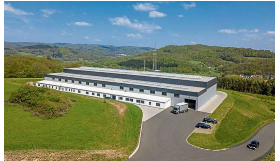
Die Firma MJM Mangner in Dautphetal-Allendorf bietet einen der modernsten Maschinenparks zur Metallbearbeitung in der Region.

Betrieb komplette Schweißkonstruktionen und Vorrichtungen bis zu fünf Tonnen Stückgewicht hergestellt werden. Dank der hauseigenen Lackiererei sowie Sand- und Glasperlenstrahlanlagen und einer Flachbett-schleifmaschine können auch die Oberflächen der Werkstücke vor Ort behandelt werden. Mangner bietet seinen Kunden aber auch externe Leistungen wie Verzinken, Verchromen, Brünieren, Härten, Phosphatieren oder Beschichten aus einer Hand, sodass die Firma die Bauteile von der Materialbeschaffung bis zur auslieferungsfertigen Abschlussbearbeitung begleitet. Neben regionalen Kunden gehören auch überregionale Firmen aus den Bereichen der Herstellung von Schienenfahrzeugen, Schaltanlagen, Verpackungsmaschinen, Fleischermaschinen, Pharmatechnik so-