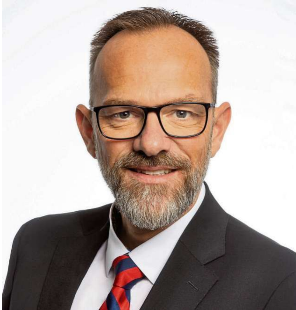
Bürgermeister Marco Schmidtke freut sich auf die Ausstellung.