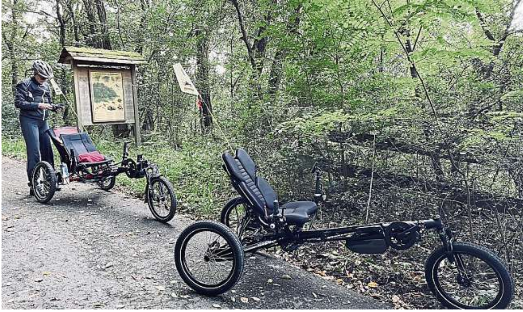
Transport oder Mobilität bei körperlichen Einschränkungen bietet Stromroad.

Unternehmen Dautphetal e.V. Wirtschaftskraft einer starken Region