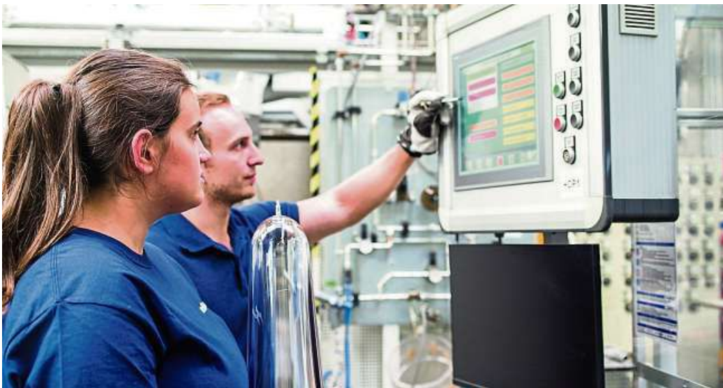
Elkamet Kunststofftechnik GmbH setzt auf enge fachliche und persönliche Begleitung aller Nachwuchskräfte in der Ausbildung und im dualen Studium.

BIEDENKOPF (red). Von Profilen und Tanks für die Fahrzeugindustrie über den professionellen 3D-Druck bis hin zu besonders geformten Leuchtstoffröhren: Elkamet Kunststofftechnik aus Biedenkopf ist eine global vertretene Experin für alle Bereiche der Kunststoffverarbeitung. Im Jahr 1955 als Lahn-Kunststoff GmbH im mittelhessischen Biedenkopf gegründet, verfügt Elkamet gegenwärtig über vier Geschäftsfelder an sechs Unternehmensstandorten in Deutschland und über die Ländergrenzen hinaus. In Biedenkopf, Wilhelmshütte und Friedensdorf (Deutschland), Myslinka (Tschechien), East Flat Rock (USA) und Taicang City (China) beschäftigt Elkamet über 1200 Mitarbeiterinnen und Mitarbeiter – die Heimatverbundenheit ist jedoch geblieben: Der Hauptstandort von Elkamet befindet sich unverändert in Biedenkopf. Hierbei konnte sich das Unternehmen vor allem dank seiner hohen Arbeitsqualität, der Freude an innovativen Verfahrenstechniken und der Motivation der Mitarbeiterinnen und Mit-